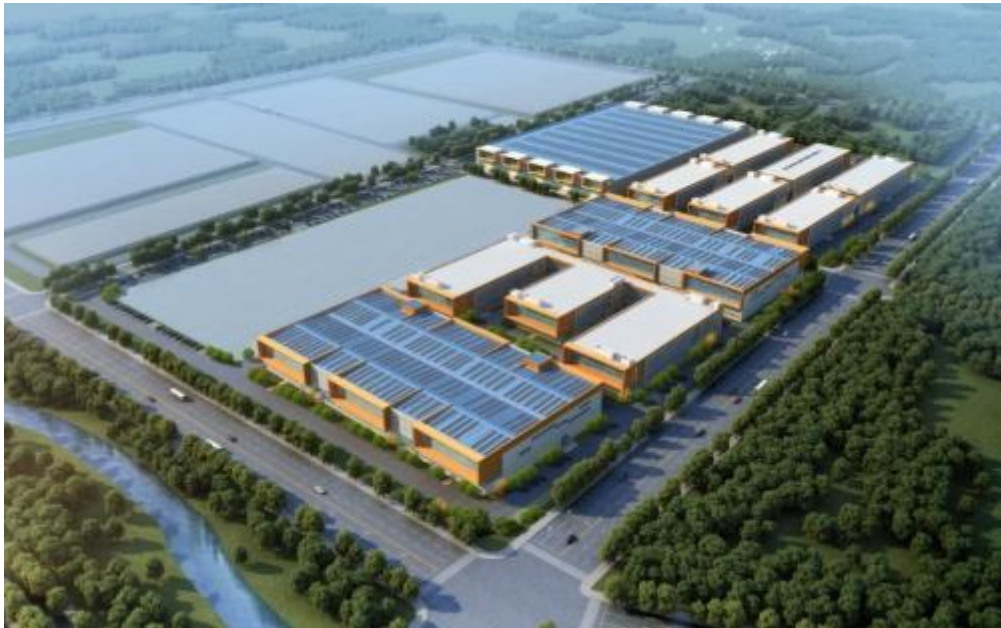
项目空间规划布局