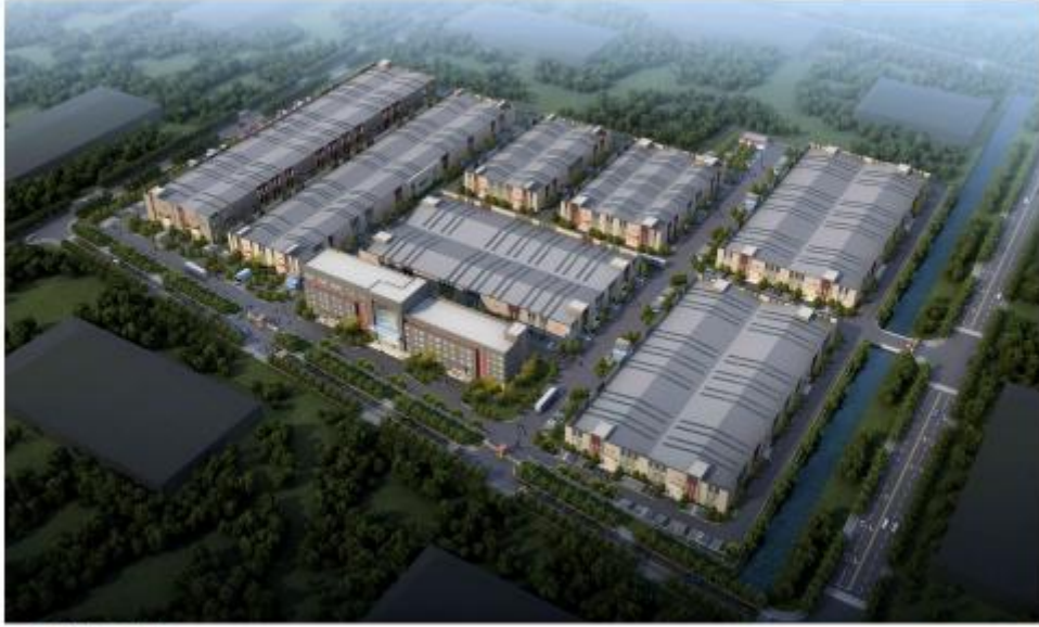
ALGN | 鸟瞰效果图

Agri Urban Design Academy Co., Ltd. 0531-87991050