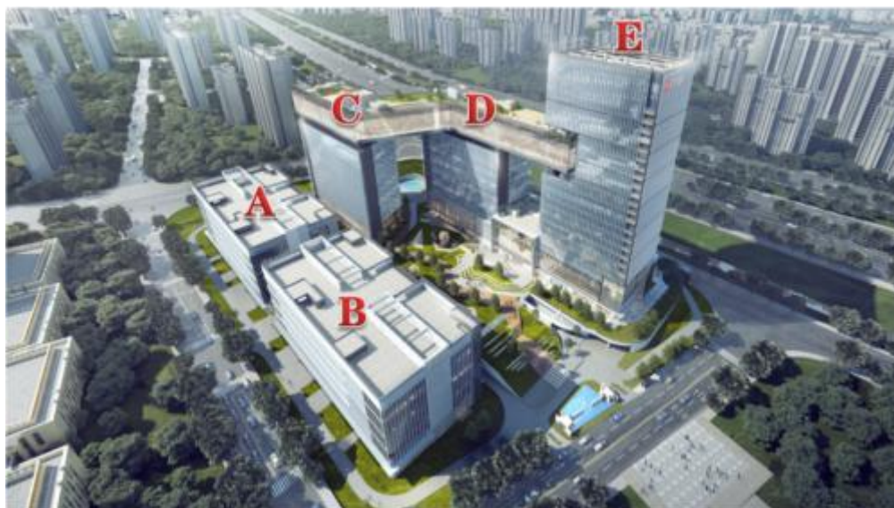
细胞产业园建筑分布示意图