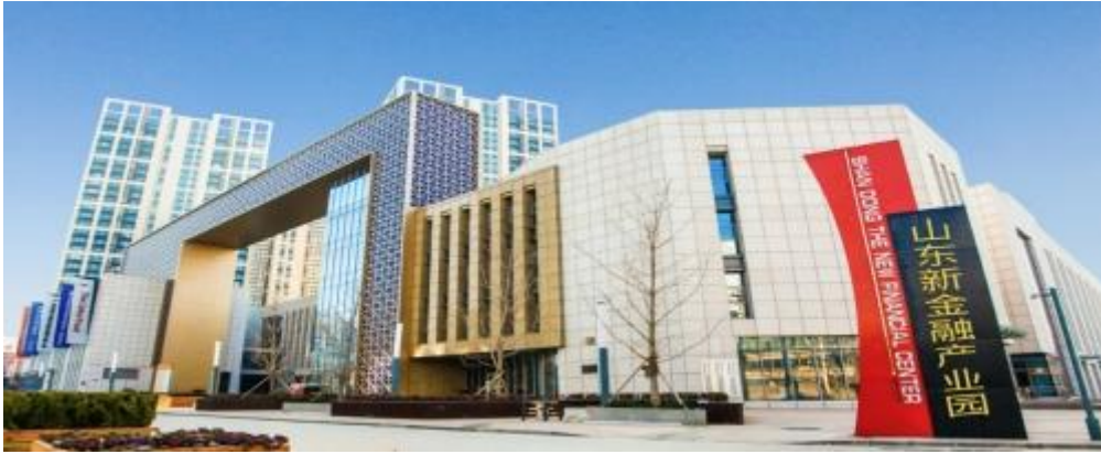
项目空间规划布局